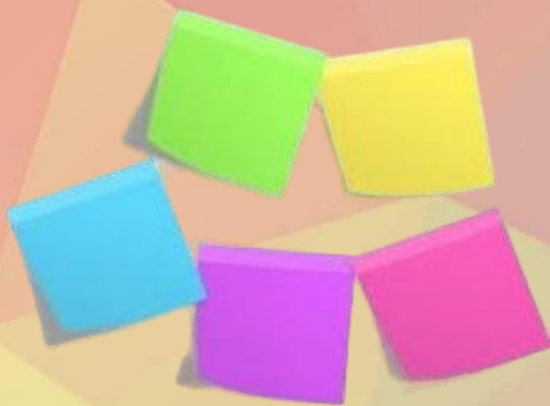
Клубный час «Приключения Рублика в детском саду»