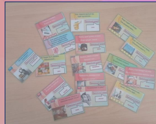
«ЗАГАДКИ, ЭКОНОМИЧЕСКАЯ АЗБУКА»