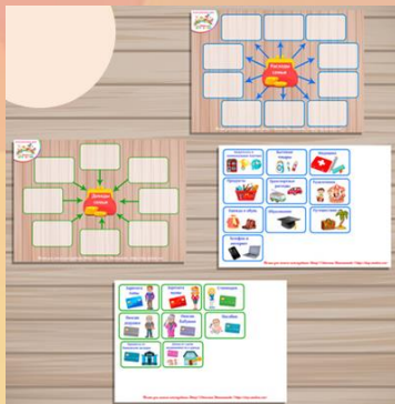
«ДОХОДЫ – РАСХОДЫ»