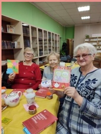
Поздравление с «Днём пожилого человека»