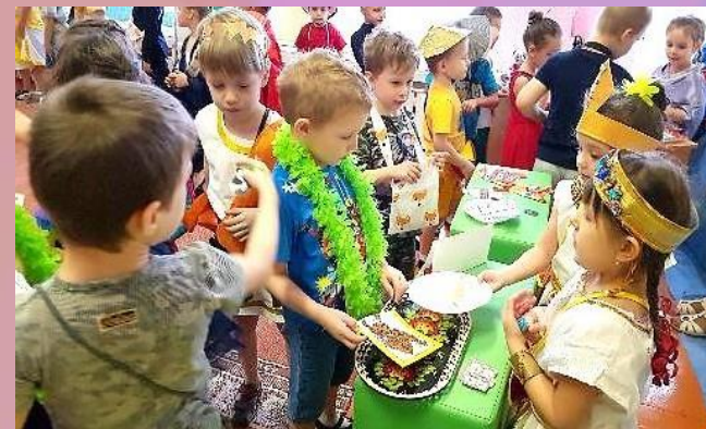
Клубный час «Профессии жителей города»