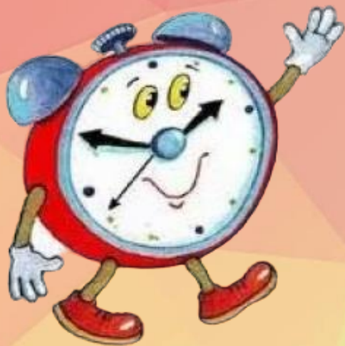
Клубный час «Семья. Доходы и расходы»