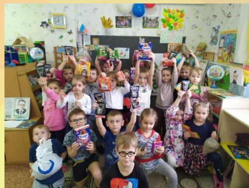
Подарки в бездомным животным «Акция протяни руку – лапам!»