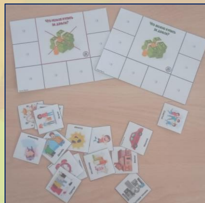
«МОЖНО - НЕЛЬЗЯ КУПИТЬ»