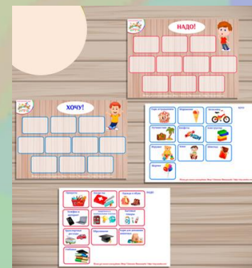
«ХОЧУ И НАДО»