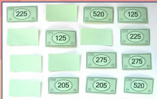
«МЕМОРИ – ДЕНЬГИ»