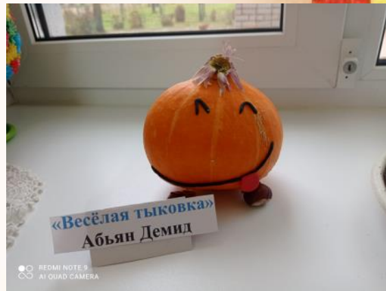
«Весёлая тыковка» Абьян Демид