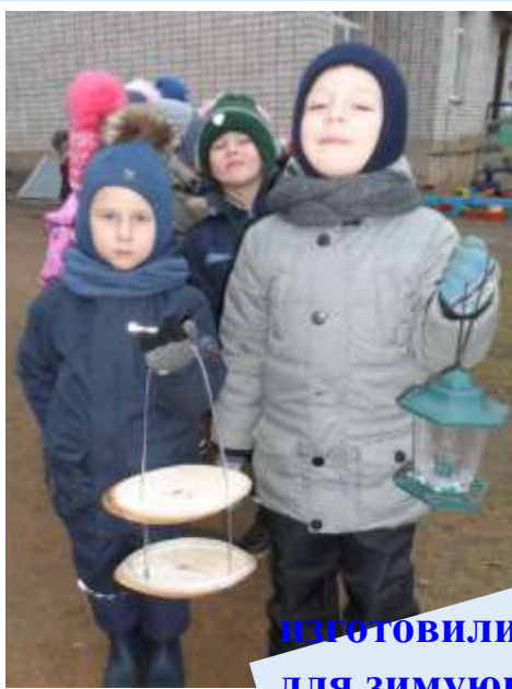
изготовили кормушки для зимующих птиц