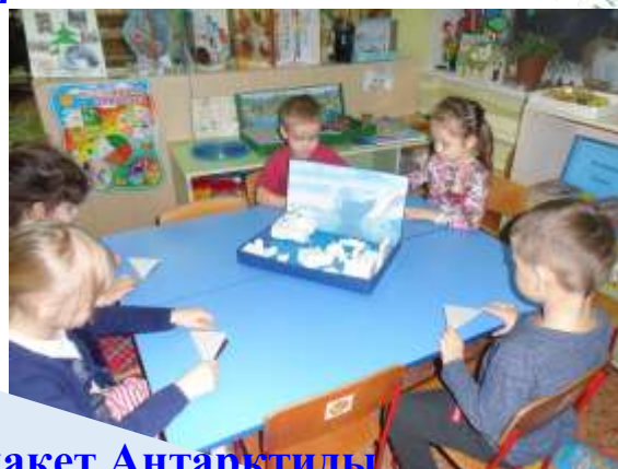
делали макет Антарктиды