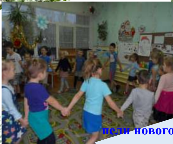
пели новогодние песни