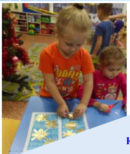
Коллаж «Лучистые звёздочки»