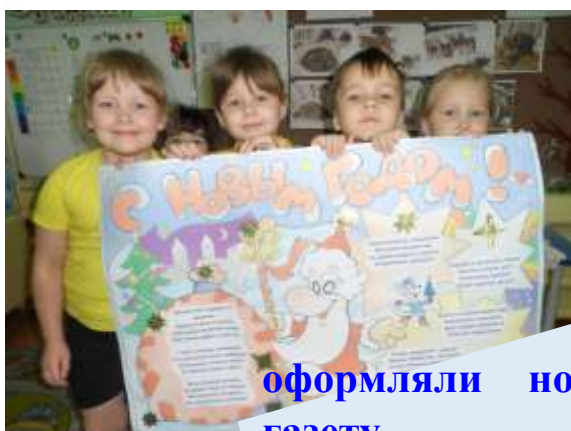
оформляли новогоднюю газету