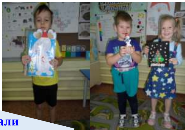
изготавливали новогодние поделки