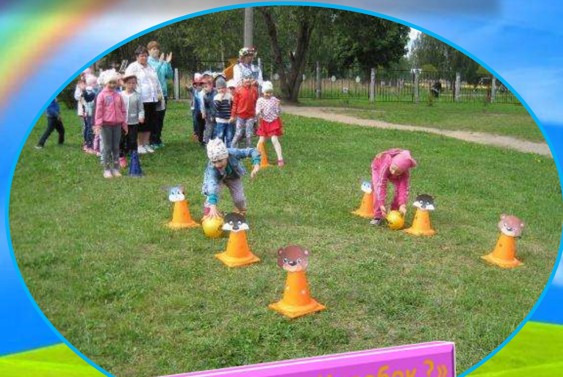
«Кого встретил Колобок?»