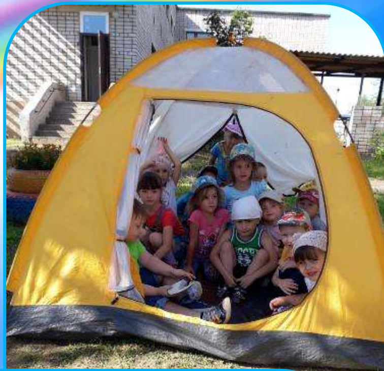
Дети средних групп прокладывали свой маршрут по территории Детского сада