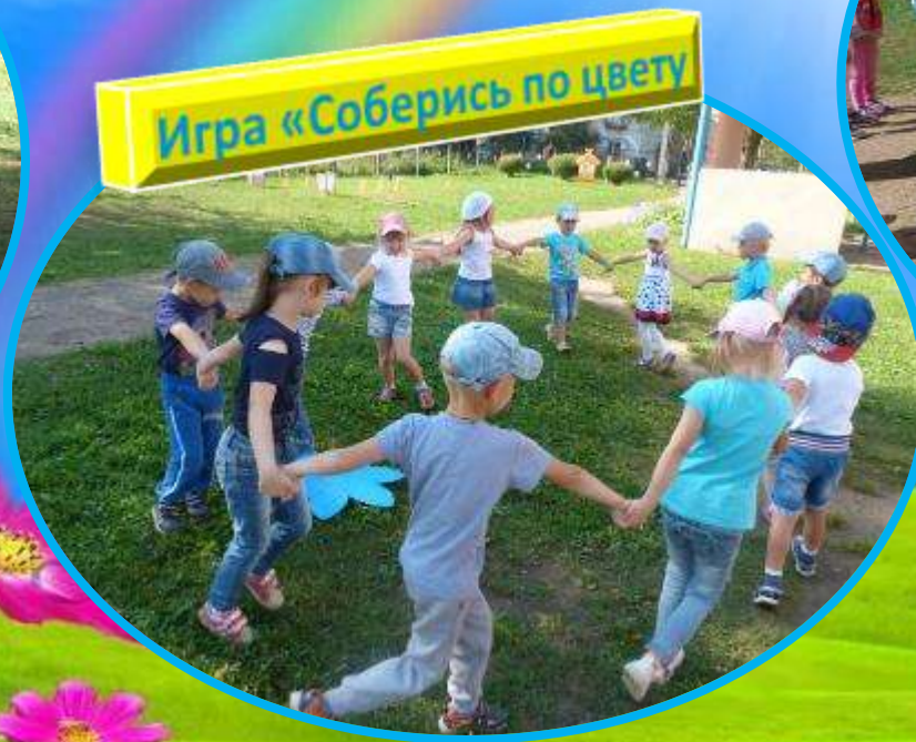
Игра «Соберись по цвету»