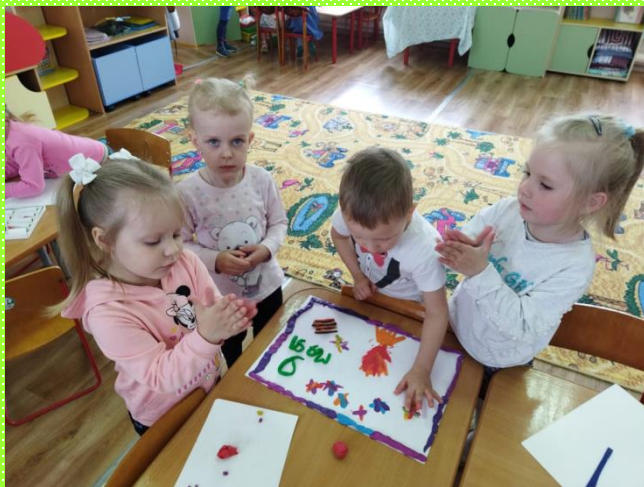
Дети второй младшей группы №10 из пластилина сделали праздничный «салют» и открытку к празднику.

Творческие занятия приобщают ребёнка ко всему прекрасному, развивают воображение и являются действенным способом познания мира.