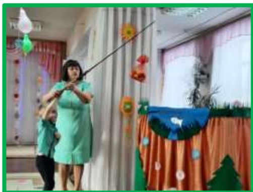
Средняя группа №6