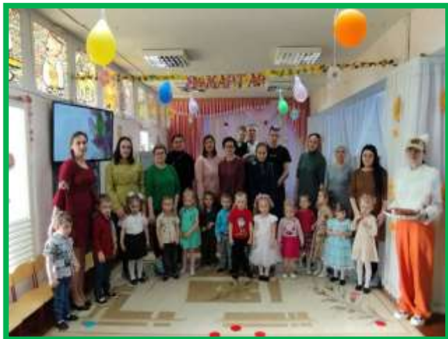
Младшая группа №10

Праздничные утренники, посвящённые нашим мамам «Праздничная рыбалка с Котом Василием»